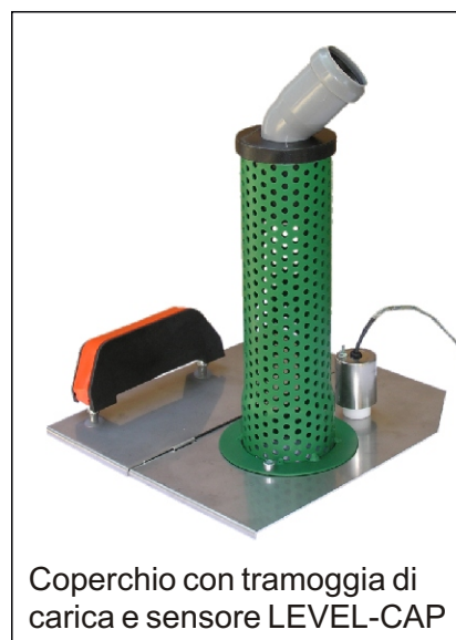
Coperchio con tramoggia di carica e sensore LEVEL-CAP